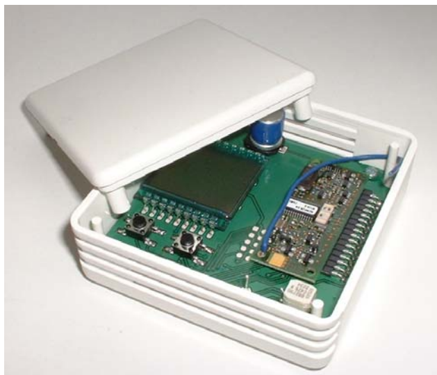
Abbildung 1: Ansicht des Gateways

Das Gerät APG01-EIB dient als Gateway zwischen Ratio-Funksensoren auf EnOcean-Technologie und dem EIB/KNX-Bus. Es verfügt über 32 Kanäle, die mit jeweils einer der folgenden Funktionen belegt werden können: